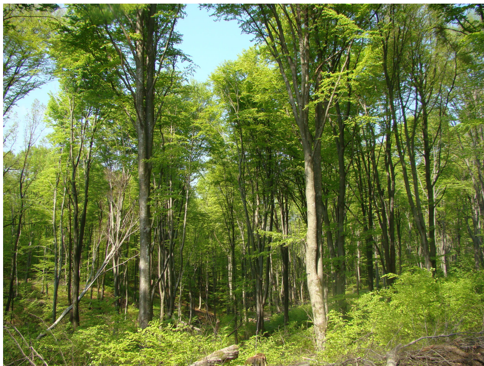
Slika 4. Bukova šuma na kiselom tlu - as. Luzulo-Fagetum Meusel 1937.

Figure 4. Beech forest on acid soil – ass. Luzulo-Fagetum Meusel 1937.