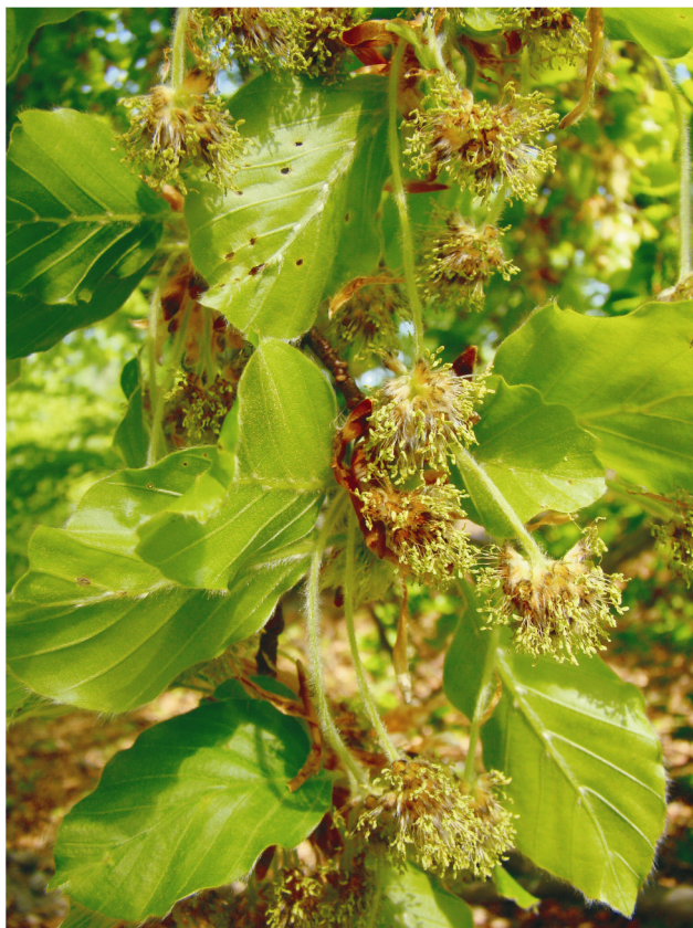
Slika 2. Fagus sylvatica L. u cvatu.