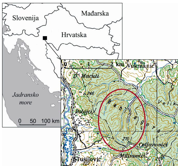
Slika 1. Geografski položaj istraživanog područja Babine gore.