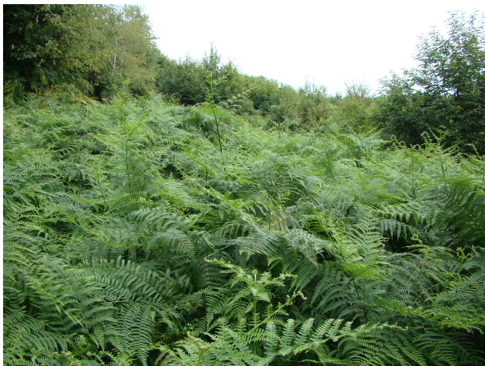
Slika 6. Sastojine vrste Pteridium aquilinum (L.) Kuhn.