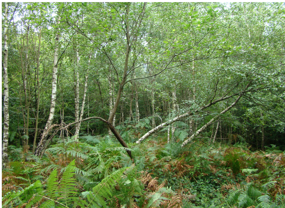
Slika 5. Šuma breze s bujadi – as. Pteridio-Betuletum Trinajstić et Šugar 1977.

Figure 5. Silver birch forest with bracken – ass. Pteridio-Betuletum Trinajstić et Šugar 1977.